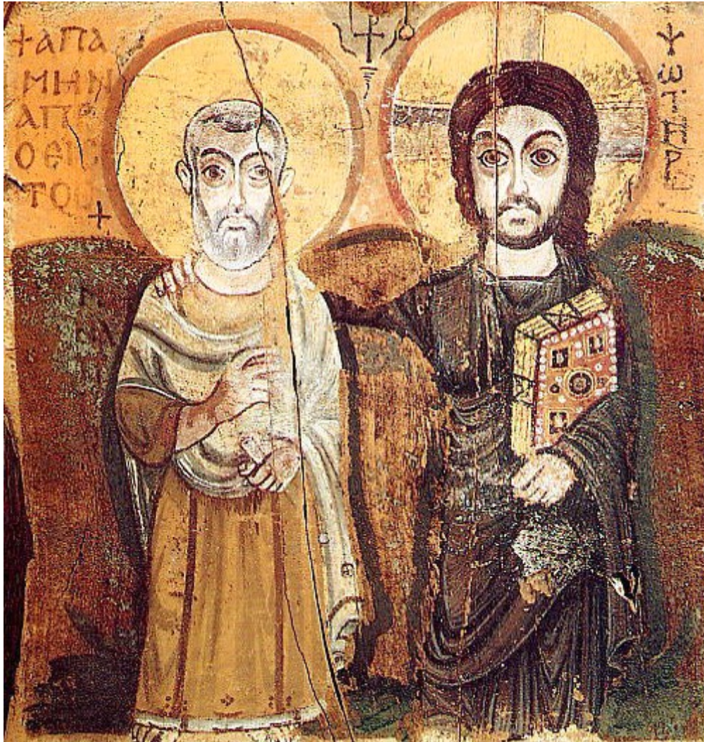
Un'icona copta del VI secolo di Cristo con San Mina

Come si può vedere, l'idea che lo stile dell'iconografia bizantina sia il risultato di secoli di evoluzione o di sviluppo - dal semplice al complesso - è del tutto insostenibile, soprattutto in considerazione l'influenza che avrebbero avuto tali dipinti egizi ellenizzati sui primi iconografi della Chiesa (verosimilmente i monaci dei deserti egiziani). Questi ritratti del primo secolo avanti Cristo avrebbero senza dubbio giocato un ruolo nella prima arte figurativa dell'Oriente cristiano. Le icone del quinto secolo non erano completamente diverse dalle icone del primo secolo. In realtà, erano molto sullo stesso stile allora come lo sono oggi.