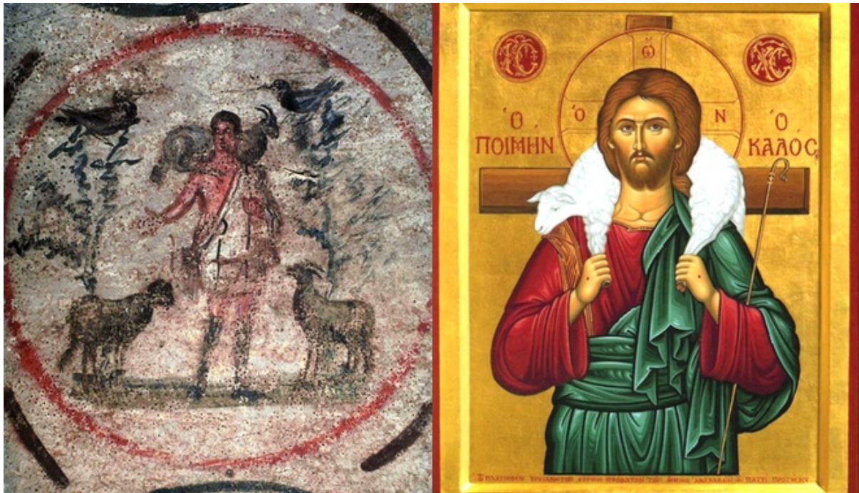
'Cristo Buon Pastore' dalle Catacombe di Priscilla (II secolo circa, a sinistra), e oggi (a destra)

Per esempio, l'arte e la cultura di Roma propriamente dette non penetrarono pienamente nei deserti egiziani ed etiopi, né ebbero una piena realizzazione nelle regioni della Palestina e Arabia. È relativamente ben noto che il culto dei santi, l'arte sacra, e altri aspetti del cristianesimo ortodosso erano cosa normale in Oriente ben prima di arrivare in Occidente (e in alcuni casi, molti dei costumi o tradizioni non si sono radicate, a causa dell'arrivo dei franchi e di altri interventi storici correlati, come l'arianesimo e la caduta della vecchia Roma). Inoltre, Roma era un luogo di maggiore persecuzione per i primi cristiani, e i costumi di arte sacra e di decorazione erano un lusso non concesso ai primi cristiani in queste regioni.