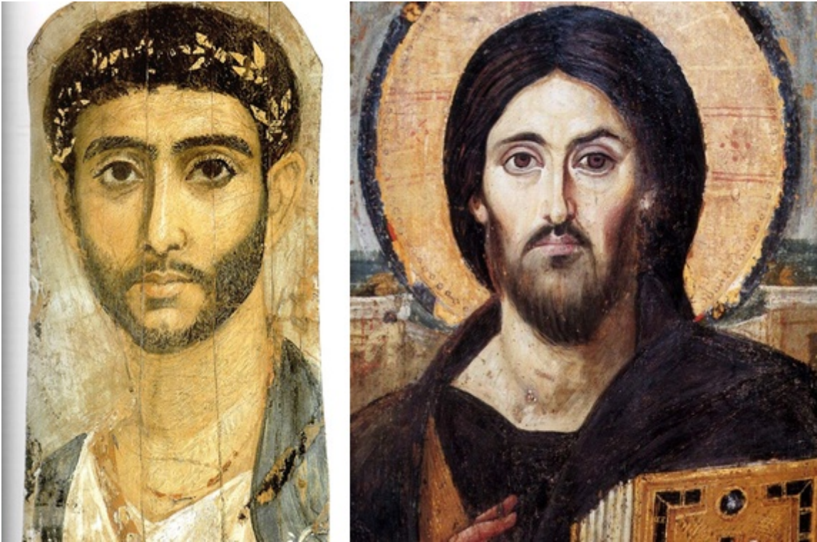
Un ritratto del Faiyum del III secolo confrontato con il Cristo Pantocratore (VI secolo) del Monte Sinai

Nello stesso periodo dei dipinti delle catacombe romane, c'erano anche "icone" portatili su legno di varie divinità pagane, come Iside e Serapide qui sotto: