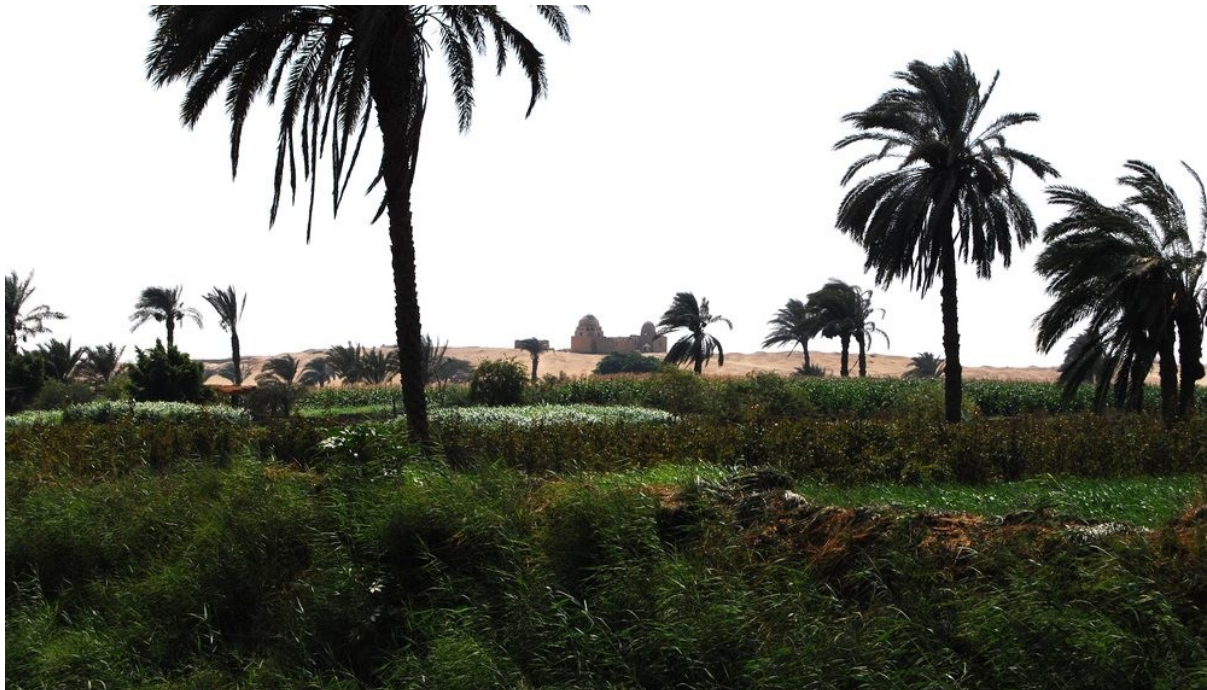
L'oasi del Fayyum in Egitto

di Gabe Martini dal blog On Behalf of All , 21 giugno 2013