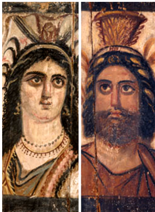
'Icane' portatili di Iside e Serapide

Nello stesso periodo dei dipinti delle catacombe romane, c'erano anche "icone" portatili su legno di varie divinità pagane, come Iside e Serapide qui sotto: