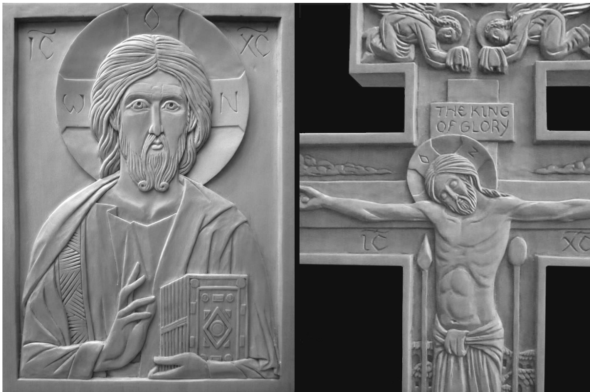
Cristo Pantocratore e crocifissione in legno. Dell'autore

di Jonathan Pageau Orthodox Arts Journal 21 novembre 2016