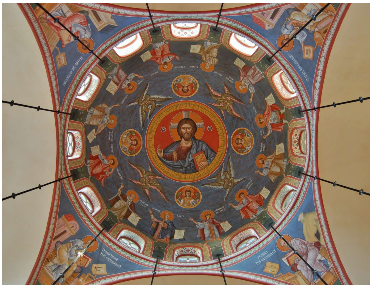
Cupola della chiesa della santa Ascensione a Mount Pleasant, Carolina del Sud. Artisti: Vladimir Grygorenko e Dmitri Shkolnik.

categoria, qualsiasi eventuale "logos" o identità, deve al tempo stesso includere ed escludere.